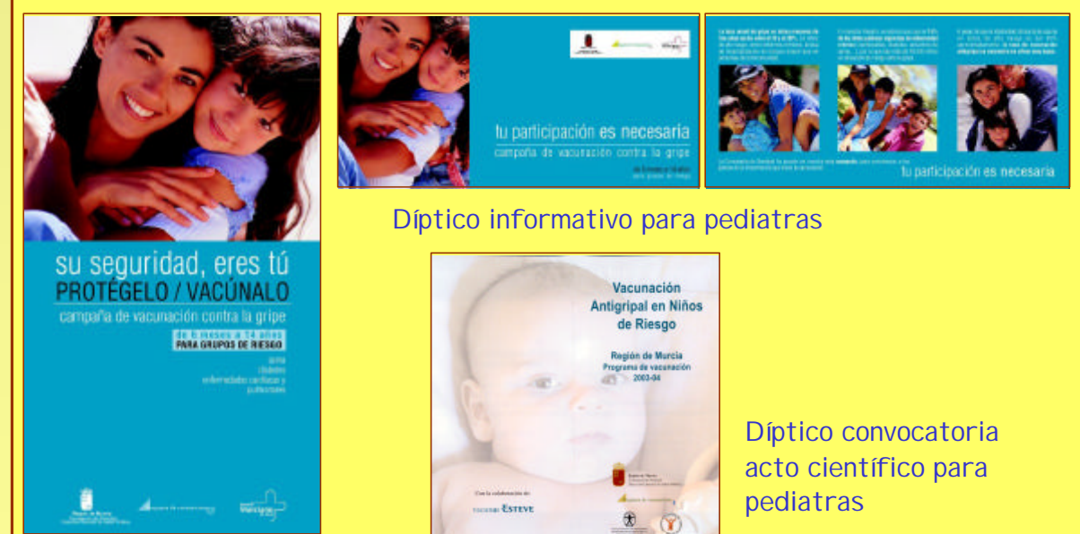
Cartel de la Campaña