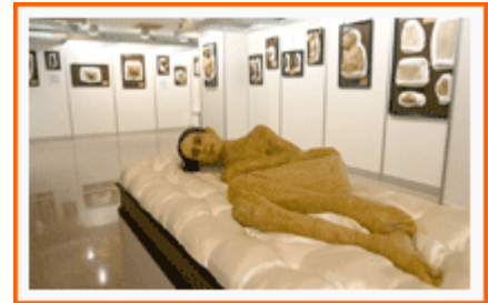
Vista general de la exposición de figuras recuperadas durante el XXXIV Congreso Nacional de Dermatología celebrado en Madrid 24-27 Mayo 2006