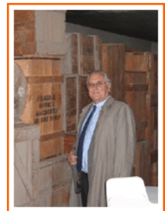
Almacén del Hospital del Niño Jesús donde se encontraron las cajas el 27-12-2006