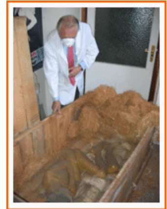
Apertura del cajón donde se encontraba la "Mujer Herpética".

Durante más de 40 años estas cajas permanecieron en un edificio anexo al Francisco Franco, actual Hospital Gregorio Marañón, en el lugar correspondiente a la antigua Consejería de Sanidad, contigua a la antigua maternidad. Se trataba de una nave en mal estado y que no reunía las condiciones adecuadas para la conservación de los moldes. En los últimos años, con la edificación de la nueva