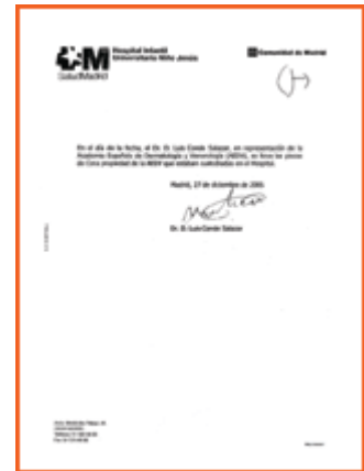
Documento de la Comunidad haciendo entrega de las figuras del Hospital de Niño Jesús